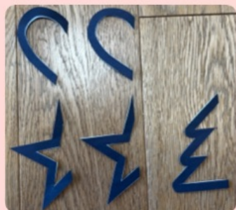
②黒い部分が残るように折ったまま切る