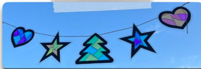
完成です♪窓辺に飾ると、色が透けて綺麗です。 ぜひ作ってみてください