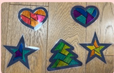
⑥表に返し、色マジックで色を塗る