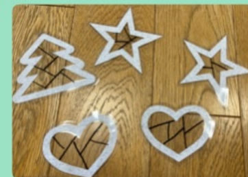
⑤裏返し、黒マジックでランダムに線を引く