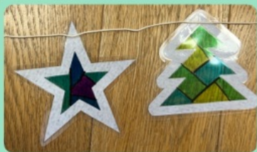
⑦裏からセロハンテープでひもを止める