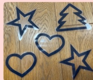
④ラミネートしたものをパーツごとに切り分ける