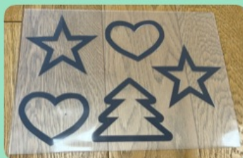
③パーツを広げ、ラミネートする